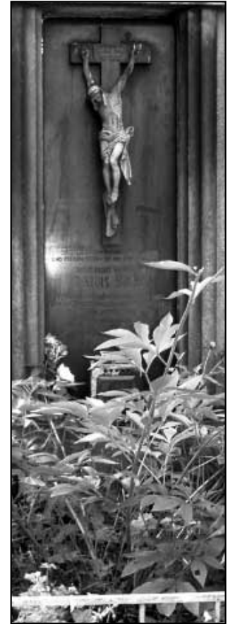
Hrob faráře Šklíby.