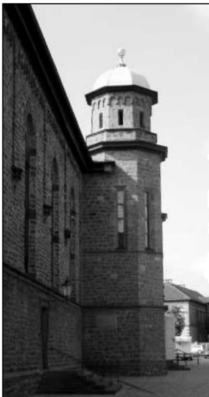
Kostel v Heinburgu.