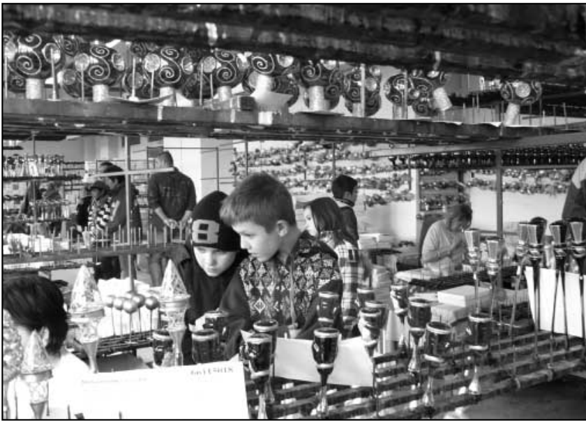
Prostě a jednoduše - neuvěřitelné

Za našimi zády se nacházela naplněná pronikavou a pro mnohé nepřijemnou „vůní“ barvírna a lakovna, kde jsme se moc nezdrželi. Zde se baňky nejrůznějších tvarů barví nebo stříkají a pak suší.