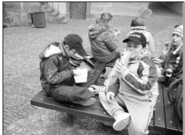
Skutečný střet kultur - rýže & bageta