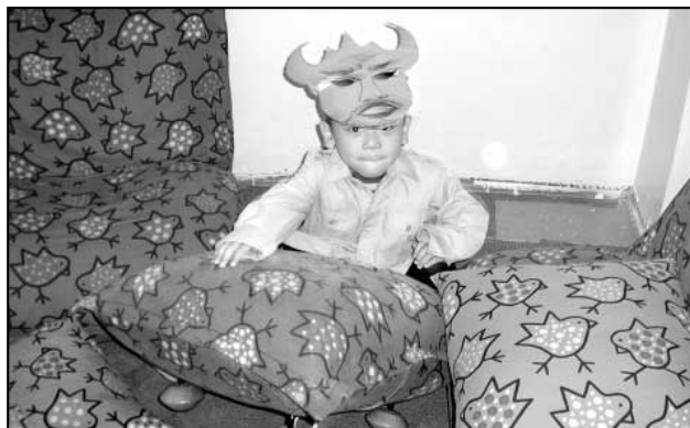
Foto: 1. Všechny strašidla pospolu • 2. Naše p. učitelky s p. uklízečkou jak je ještě neznáte • 3. Strašidelné rejdnění • 4. Ja se skutečně bojím ...