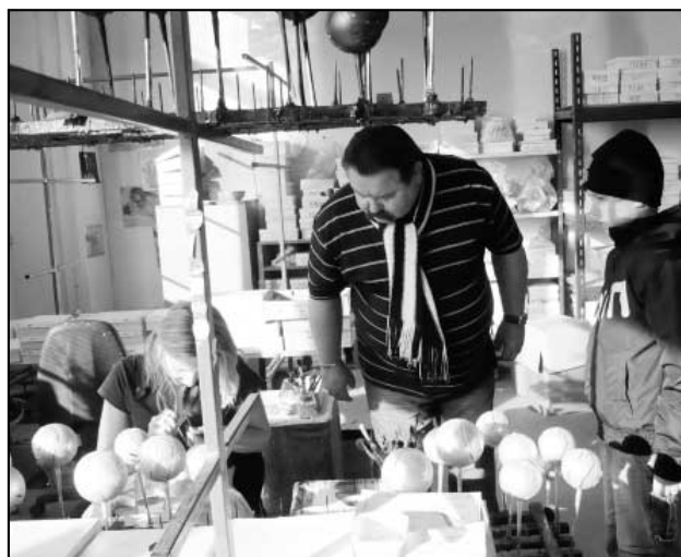
Foto: 1. Tak takhle se vyfukují pravé české skleněné vánoční ozdoby • 2. Aby baňky nebyly průhledné, musí se zevnitř nejdříve postříbit • 3. Pak je ještě potřeba vánoční baňky na povrchu obarvit a usušit • 4. Veškeré zdobení baněk je zhotovováno dle fotografické předlohy zásadně ručně