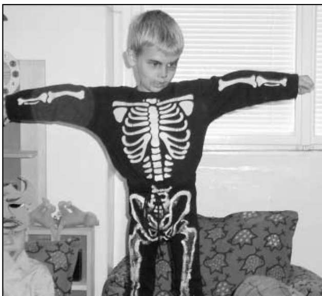
Tak co, jak mi to sluší