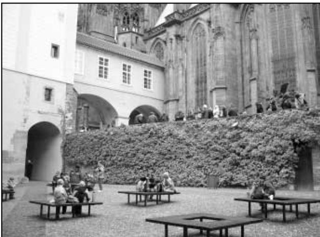
Svačina v areálu Pražského hradu

Ti menší z nás, kteří ještě nemají ve škole předmět vlastivědu (tj. I. A polovina II. třídy - 1., 2. a 3. ročník, pouze s