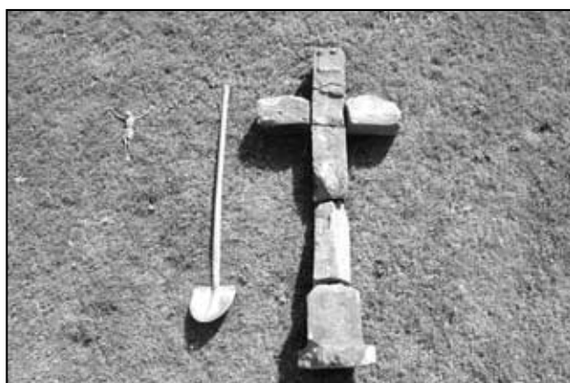
Kříž ze Špičáku