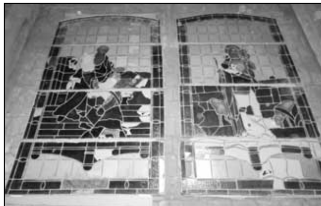
Okna č. 3 a 4 z prostřední části kostelní lodě

Mnozí by mohli říci, že tento pokus o zpomalení chátrání těchto čtyřech mnohdy bez rozmyslu vandalsky poničených vitráží je zcela zbytečný, ale ... uvědomme si, že jsou to jedny z mála vitráží, které se podařilo v našem krušnohorském koutku zachovat až do dnešních dnů (v sousedních farních kostelích (tj. v Krásném Lese, na Nakléřově, v Tisé, ... ) by jste dnes vitráže hledali marně). - Záleží tedy na pouze nás, zdaleka chceme to málo, co nám z našeho torza farního kostela sv. Mikuláše v Petrovicích zbylo, zachovat pro ty, kdo v Petrovicích budou žít po nás a nebo nikoli.