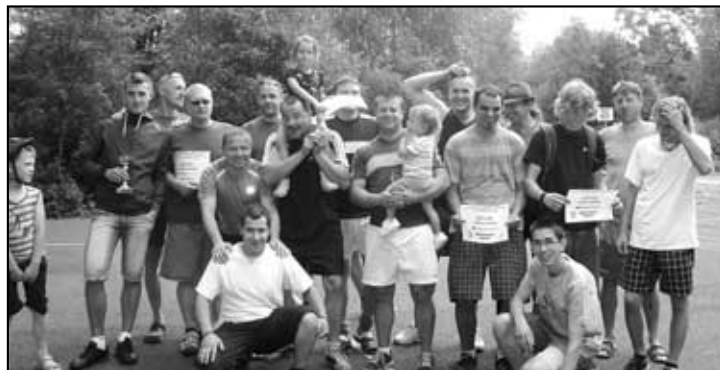
Sova cup 2011