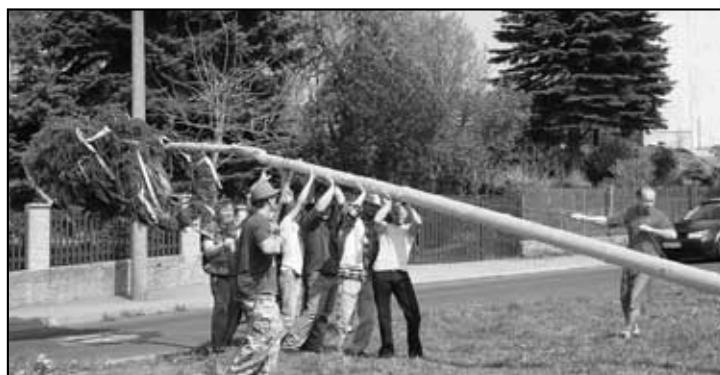
Pro májku v lese a stavění máje 2011