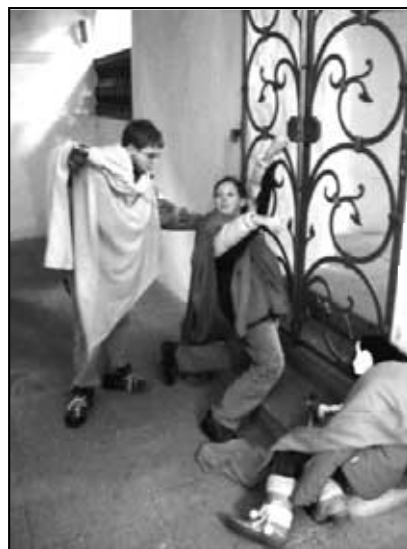
Vražda knížete Václava.

Zde jsme však tak trochu selhali, neb představitel sv. Václava na následky bodného zranění zemřel dříve, než stačil odpustit svému bratrovi Boleslavovi, kterého navíc hrál skutečný rodný bratr hlavního představitel, jeho bratrovražedný zavrženíhodný zločin. - Nu co, nikdo přece není dokonalý, a protože jsme měli dost času, závěrečnou scénu jsme proto sehraji ještě jednou a tentokrát zcela správně.