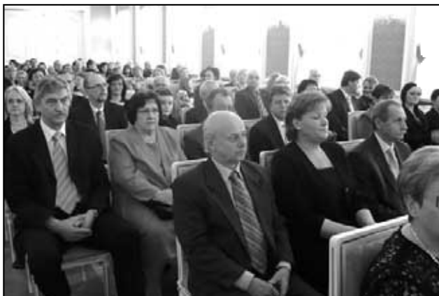
Ocenění pedagogové a jejich doprovod.

Ano. - Medaili Ministerstva školství, mládeže a tělovýchovy už několikrát přebíral někdo za někoho v zastoupení (vesměs se jednalo o velmi blízkého rodinného příslušníka), ale ještě nikdy to nebyl žák (navíc školou stále ještě povinný), který má svého učitele (promiňte - p. učitelku)