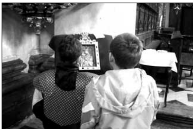
Před Palladiem země české.

Tím ale naše návštěva Staré Boleslavi ještě ani zdaleka neskončila. - Málokdo totiž ví o tom, že kníže Václav přijel do Staré Boleslavi (Pokračování na následující straně)