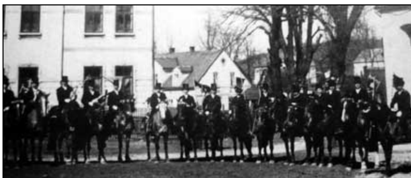
Velikonoční jízda v Krásném Lese v roce 1936-1937.

1946). - Tento prastarý velikonoční zvyk se do současnosti na území České republiky v nezměněné podobě kontinuálně dochoval sice jenom v Lukavci ve Slezsku, ale rok od roku je čím dál tím více míst (zejména v pohraničních obcích Krušných hor - např. v Mikulášovicích), kde se o obnovu Velikonočních jízd s úspěchem snaží.