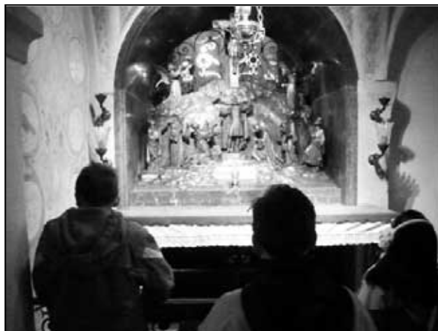
Místo, kde byl zabit kníže Václav.

Velice nás však mrzelo, že na zpáteční cestě nám již nevyšel dosta-