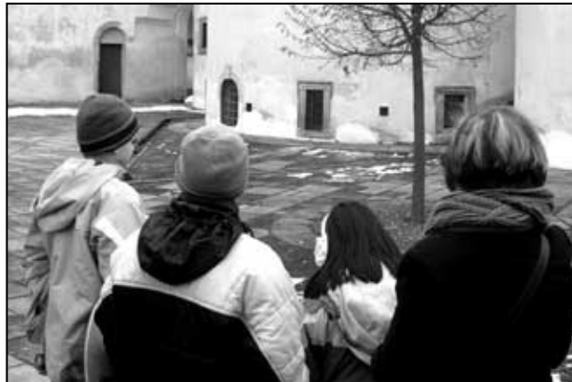
Před bazilikou sv. Václava ve Staré Boleslavi.