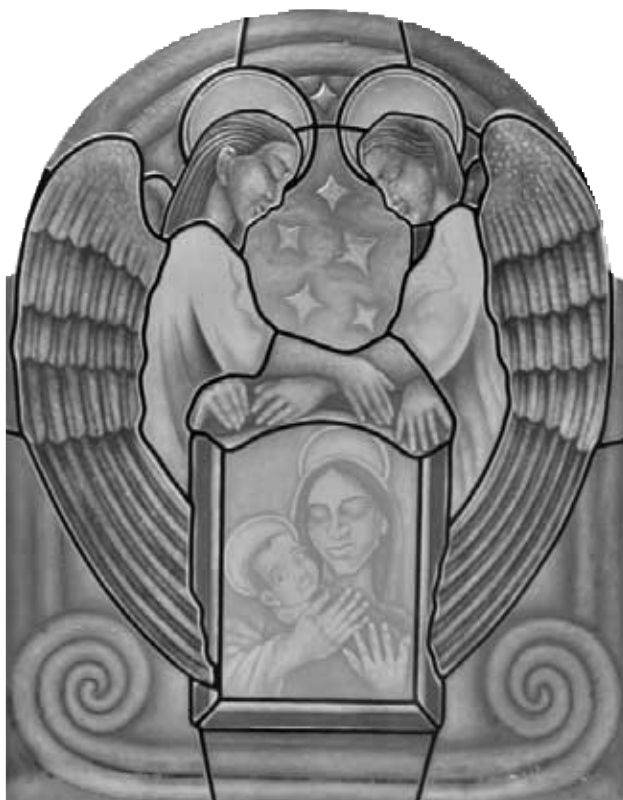
Vitráž určena do nadstavce petrovického oltáře.