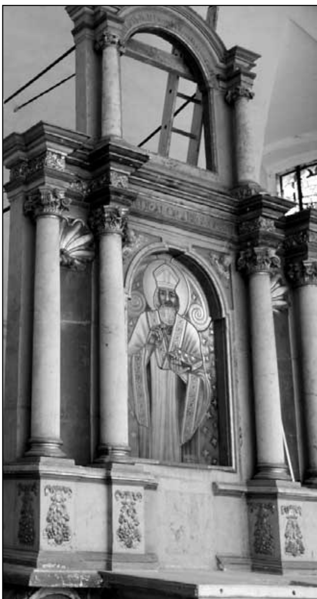
Nová oltářní vitraj sv. Mikuláše v Petrovicích.

O návratu původního oltářního obrazu sv. Mikuláše (olej na plátně z roku 1817) nebylo možné díky neexistenci střechy v současné době reálně uvažovat, a proto členové Petrovického spolku pro obnovu a zachování tradic začali hledat jiné vhodné řešení stávajícího stavu. - Po několika odborných konzultacích s pracovníky Národního památkového ústavu (Pokračování na následující straně)