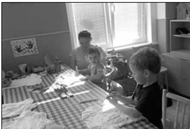
Tvoření s dětmi - malování triček.