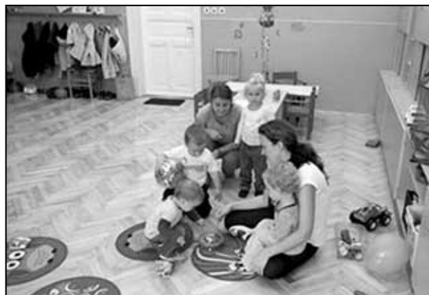
Program pro děti - hudební nástroje.