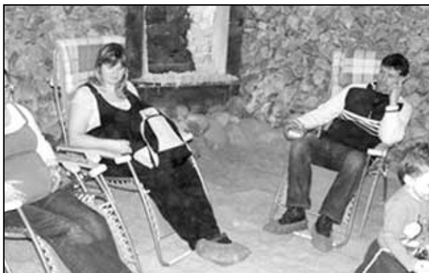
Solná jeskyně Teplice.