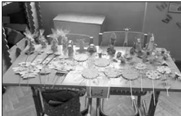
Odměny pro předškoláky.