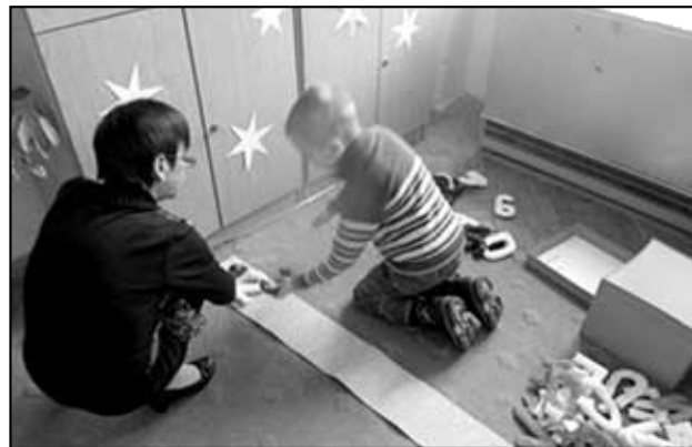
Skládání číselné řady.