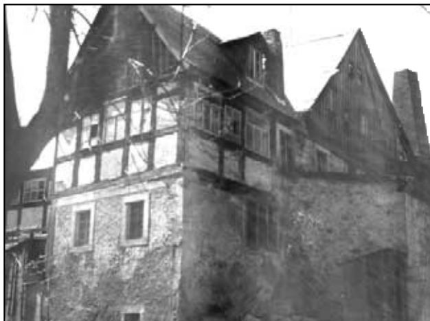
Hasenmühle, říká se, že v tomto domě Napoleon přenocoval.