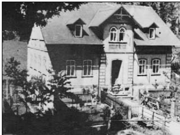
Petrovice č.p. 299 - rodný dům Franze Kühnela.