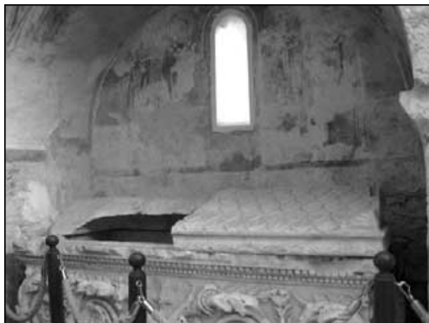
Sarkofág s freskami na chodbě baziliky.