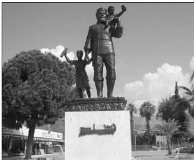
Socha sv. Mikuláše na hlavním náměstí v Myře.

Je 9. dubna roku 2014. Náš autobus zastavuje na hlavním náměstí v Myře, které zdobí socha sv. Mikuláše. Jen kousek odtud je vstup do kostela ve kterém sv. Mikuláš kázal a kde byl pohřben. Vstupujeme do byzantské baziliky s nádhernými nástěnnými freskami a procházíme prostorami, které jsou