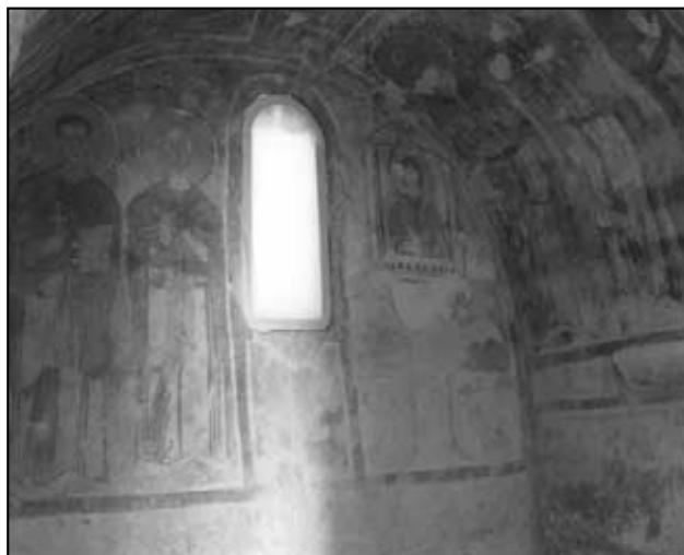
Fresky v bazilice.

poznávané duchem slavné minulosti. Stojím v hlavní chrámové kapli a vysoko nade mnou se klene její kupole. Je to zvláštní pocit uvědomit si, že zde osobně kázal sám Mikuláš, že po těchto chodbách kráčet, že zde opravdu žil, dýchal. Že to byl člověk z masa a kostí stejně jako já, která o víc než 1500 let později se nachází ve stejném prostředí jako on. Já, člověk z jeho daleké budoucnosti. Procházím vnitřním dvorkem s uloženými nádhernými hlavicemi zbylých sloupů, dotýkám se stěn a pozoruji hru světla a stínů z oken. Stojím zde s posvátnou úctou před jeho prázdným sarkofágem, před kameny, ve kterých bylo uloženo jeho tělo. Tělo, jehož nepatrná částička doputovala oklikou z prastarého lýkijského města přes italské Bari až do země české, ležící kdesi za mořem, na její daleký sever, do vesnice jménem Petrovice.