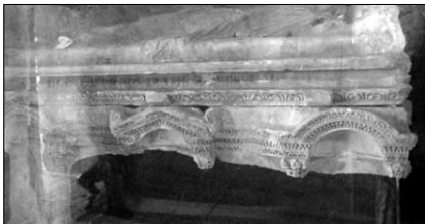
Sarkofág sv. Mikuláše